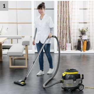
1 Helppoa energiansäästöä