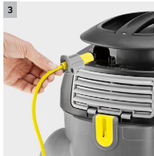
3 Helppo huoltaa

■ Vähentää ajankulutusta ja huoltokustannuksia.